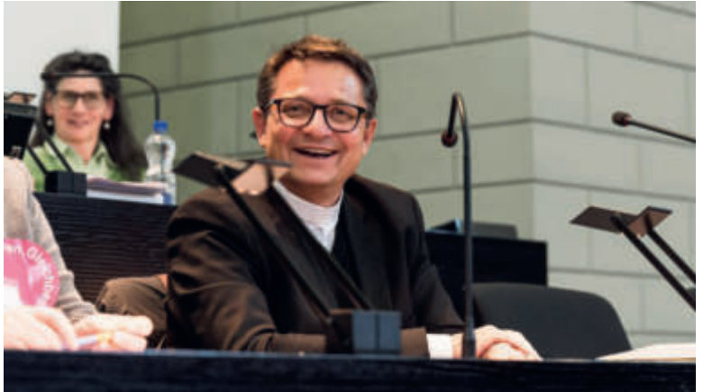
Bischof Felix Gmür im Mai 2019 vor der Luzerner Synode.

Der Schweizer Kardinal Henri Schwery ist am 7. Januar im Alter von 88 Jahren gestorben. Schwery wurde im Alter von 45 Jahren Bischof von Sitten; von 1983 bis 1988 präsidierte er die Bischofskonferenz. In seine Amtszeit fiel das Schisma durch Erzbischof Marcel Lefebvre, der 1988 gegen den Willen des Papstes in Ecône vier Bischöfe weihte. Nach 18 Jahren gab Schwery das Amt aus gesundheitlichen Gründen ab, seitdem lebte er zurückgezogen im Wallis. Papst Johannes Paul II. nahm ihn 1991 in das Kardinalskollegium auf.