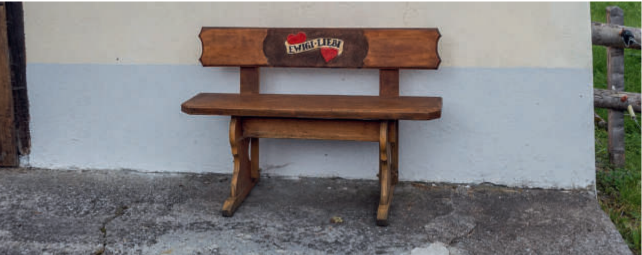
Am 14. Februar ist Valentinstag: Bank für Verliebte auf dem Wirzwei.

S iehe, schön bist du, meine Freundin, siehe, du bist schön. Deine Augen sind Tauben. Schön bist du, mein Geliebter, verlockend. Frisches Grün ist unser Lager, Zedern sind die Balken unseres Hauses, Zypressen die Wände.