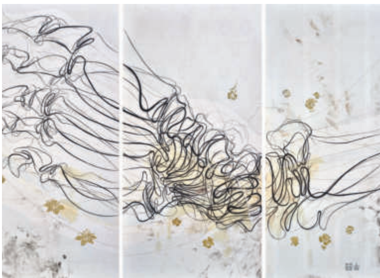
Das Hungertuch 2021.