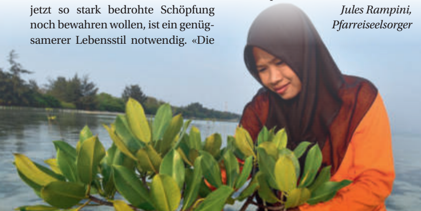
Bäuerin in Indonesien pflanzt Mangrovenbäume zum Schutz ihrer Insel vor immer häufigeren Überschwemmungen.